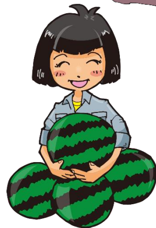
スイカ収穫体験 (季節によります)