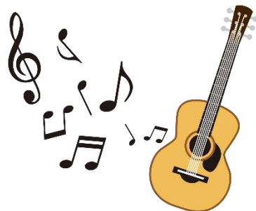
ギターの演奏会があります (不定期)